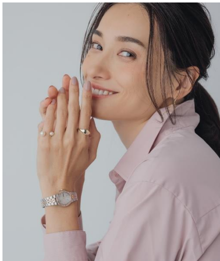
エレガンスな雰囲気を纏える ＜パールベージュ×コンビベルト＞

『アテナ特注 ソーラーパワーウォッチ』 価格：28,000円（税込）全2色（数量限定 各色600個）