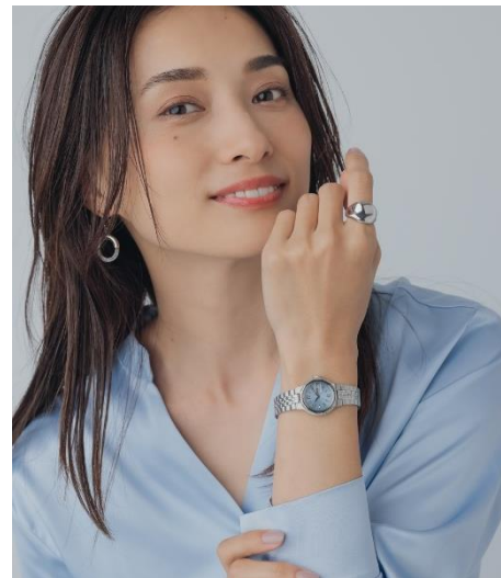
肌の透明感を際立たせる ＜ブルー×シルバーベルト＞